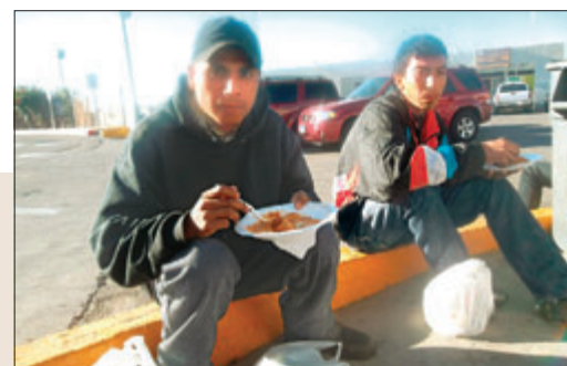
Deportados reciben albergue y alimentos en Mexicali.

En 7 años el gobierno de Obama separó a 1.6 millones de familias mexicanas