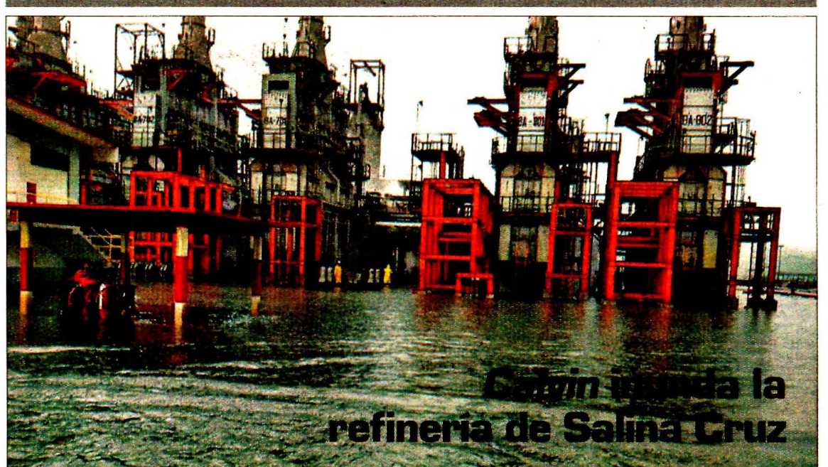
Catón inunda la refinería de Salina Cruz