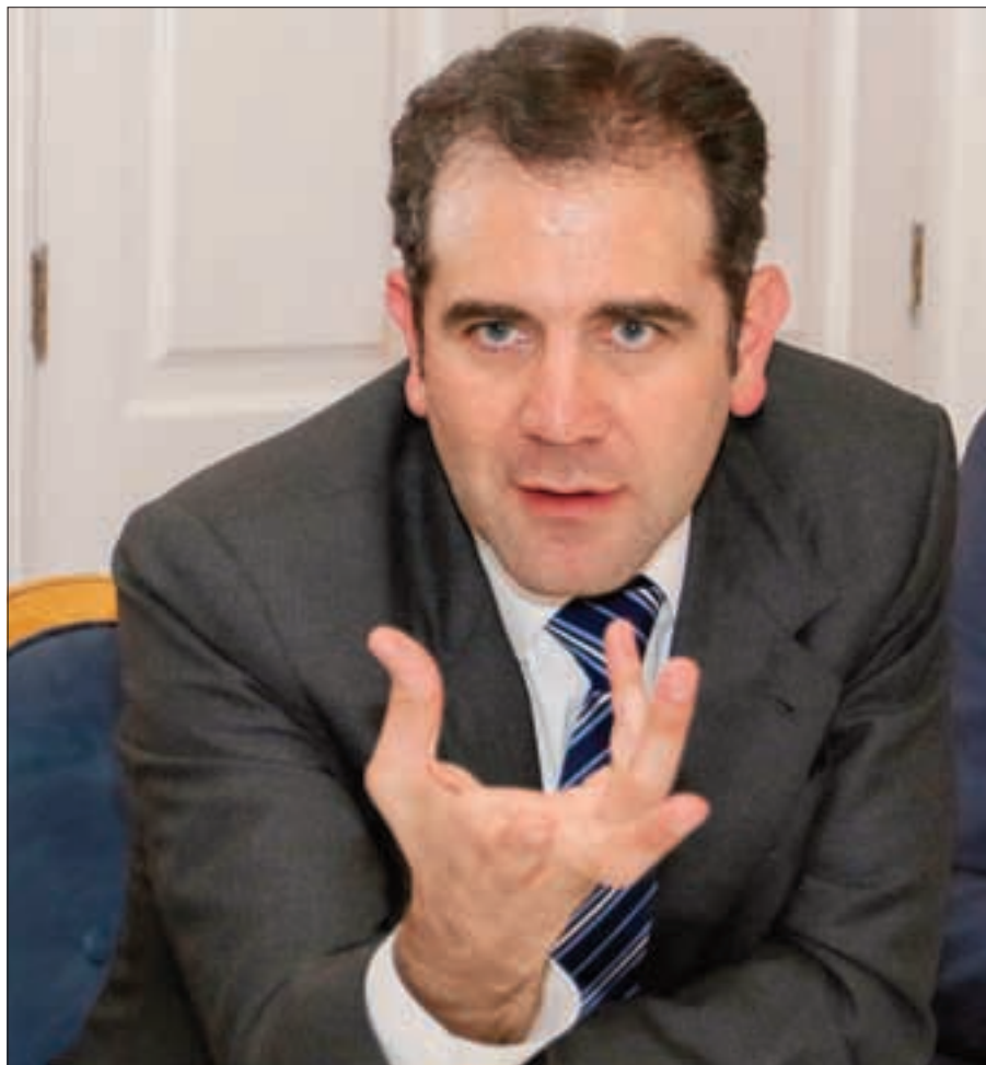
Lorenzo Córdoba, Consejero Presidente del INE, durante la reunión de trabajo con Crónica .

“Si no damos ganador, nadie puede declararse ganador, y si en esas condiciones algunos deciden hacerlo, saldré a desmentirlos”, advierte