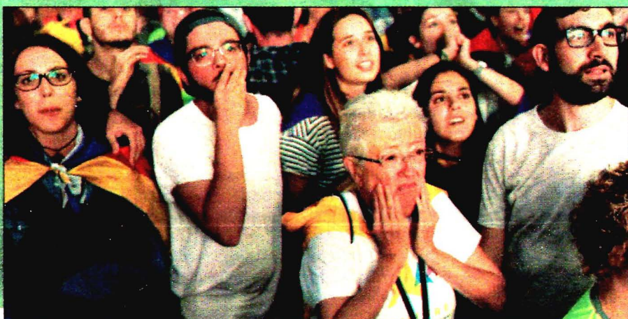
En segundos, catalanes pasaron ayer en Barcelona de la euforia a la decepción.