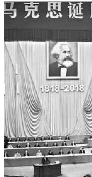
El presidente chino Xi Jinping dio un discurso por el bicentenario del natalicio de Carlos Marx el viernes pasado

Quien controle la IA impondrá su modelo.