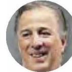
José A. Meade

El músculo petrolero se mostró ayer en Poza Rica, Veracruz, a favor del candidato a la Presidencia, José Antonio Meade. Lo arroparon más de 12 mil personas en la plaza cívica de esa ciudad. Ahí, el abanderado del PRI-PVEM-Panal se comprometió a regresar la producción petrolera a tres millones de barriles diarios, con lo que se fortalecería el país.