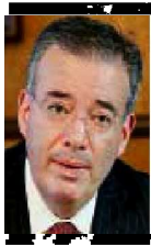
Alejandro Díaz de León

:::: Nos dicen que, como lo marcan los criterios generales de comunicación del Banco de México (Banxico), los miembros de la Junta de Gobierno han estado calladitos