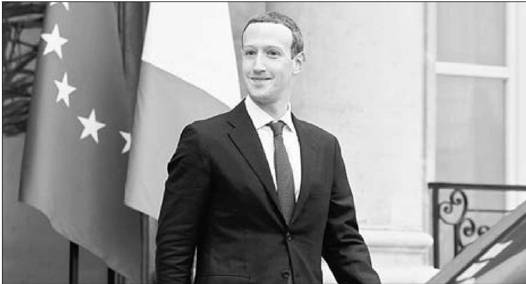
El director ejecutivo de Facebook, Mark Zuckerberg, sale del Palacio del Elíseo

después de reunirse con el presidente francés, Emmanuel Macron.