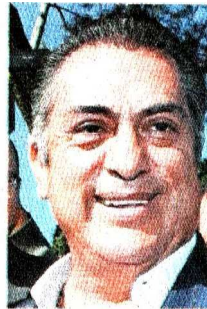
Jaime Rodríguez Calderón

Nos cuentan que mientras el gobernador con licencia de Nuevo León, Jaime Rodríguez Calderón , El Bronco , se ufana de haber completado las firmas necesarias para su registro como candidato independiente a la Presidencia de la República, los magistrados federales del Segundo Tribunal Colegiado del Cuarto Circuito tundiéron a su “cacareada” Fiscalía Anticorrupción, al dejar sin efecto el embargo de un rancho de 36 hectáreas —valuado en aproximadamente 5 millones de pesos— que el ex gobernador Rodrigo Medina (PRI) posee en el municipio de General Terán. El amparo ganado por la defensa