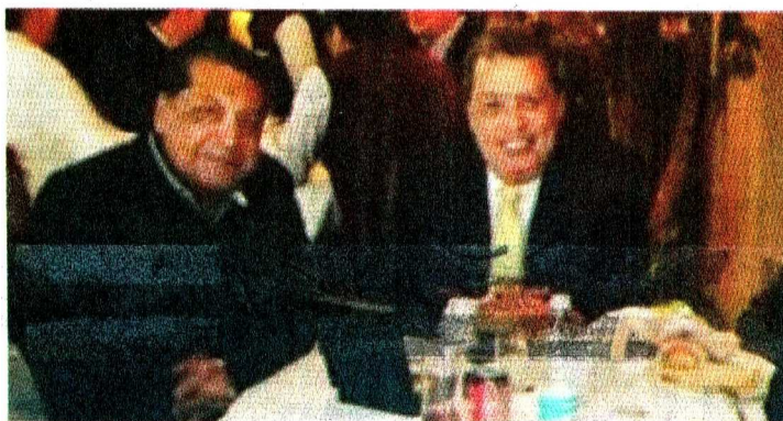
Héctor Bautista y Ángel Heladio Aguirre

Sin pudor alguno, en días pasados se dejaron ver juntos en la Ciudad de México, el líder perredista Héctor Bautista y el ex gobernador de Guerrero Ángel Heladio Aguirre , quien tuvo que desistir de su intención de competir por una diputación federal como candidato del Frente conformado por la coalición PAN-PRD-MC. Ni bien había hecho públicas sus ambiciones de competir, don Ángel se tuvo que bajar de la candidatura ante la molestia que su aspiración generó en diversos sectores de la sociedad, e incluso entre algunos de los miembros de la coalición, como el propio candidato presidencial, Ricardo Anaya , que deslindó al Frente de la candidatura. Sin embargo, al parecer Bautista es amigo de sus amigos, pues no sólo se reunió en un lugar público con Aguirre, sino que hasta posó sonriente para una foto.