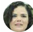
Mariana Gómez del Campo