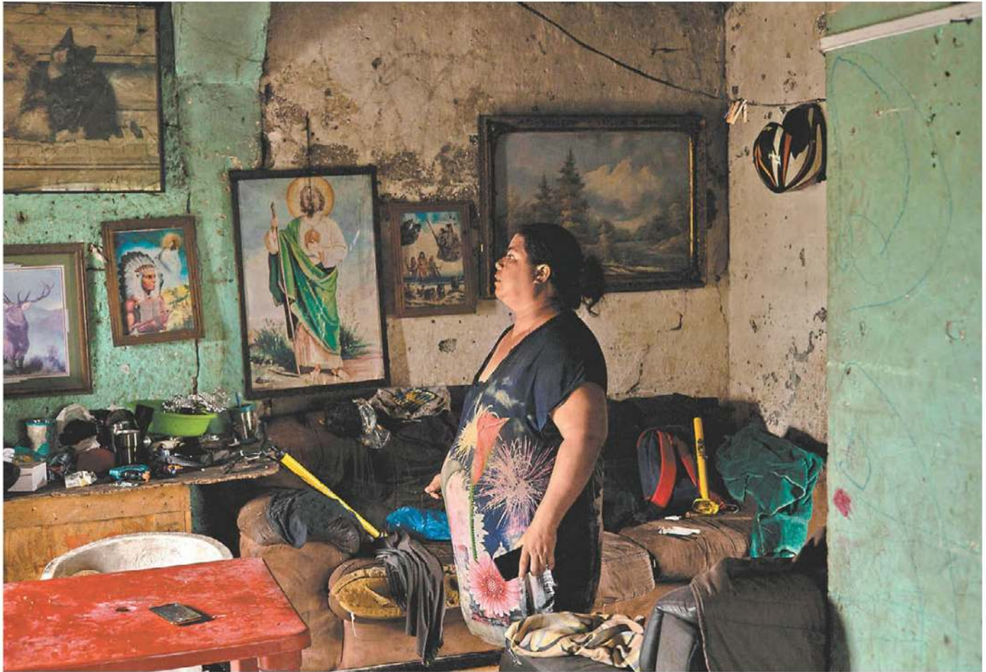
Una estructura social culposa es tan tóxica como una familia con esas mismas características. OCTAVIO HOYOS