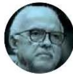
NAVARRO APOYA ASPIRACIÓN DE ADÁN AUGUSTO

› Es la secretaria del Trabajo, Luisa María Alcalde , y nadie más, quien lleva la negociación con el sindicato de Notimex para entablar acuerdos ante la extinción de esa agencia de noticias del Estado. En ese tenor, aseguró que se respetará el contrato colectivo y los derechos, individuales, de todos los trabajadores.