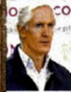
Alfredo del Mazo

:::: Al gobierno del Estado de México le aplicaron el Día de los Santos Inocentes por adelantado en el paquete económico para 2022. Nos explican que el equipo del gobernador priista Alfredo del Mazo llevó una buena negociación del presupuesto hasta la mismísima Secretaría de Gobernación, pero el plazo fatal acordado por Morena y el PRI para votar el paquete fiscal se venció el lunes, sin que hubiera votación y lo que es peor, no parece que vaya a haber en los próximos días. Nos dicen que este es el segundo año consecutivo en que los legisladores morenistas llevarán la aprobación del presupuesto hasta enero del próximo año. Pero las preguntas que vienen a los políticos mexiquenses son: ¿Quién es el responsable de este fracaso? ¿Gobernación, Morena, el PRI o quién les creyó por segundo año que cumplirían con su palabra? ¡Inocentes palomitas!