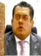
Sergio Gutiérrez Luna

:::: Nos recuerdan, por cierto, que tras los recursos que el presidente de la mesa directiva en San Lázaro, el morenista Sergio Gutiérrez Luna , interpuso contra el INE ante la Suprema Corte de Justicia de la Nación, la Fiscalía General de la República y el Órgano Interno de Control del propio órgano electoral, los únicos que se la pensaron para decir algo fueron los aliados de Morena. El lunes, cinco días después, el PT salió a respaldar las denuncias del veracruzano, a quien reconoció por combatir las "conductas draconianas" de los consejeros del INE. Ahora la pregunta es, ¿y los verdes, para cuándo?