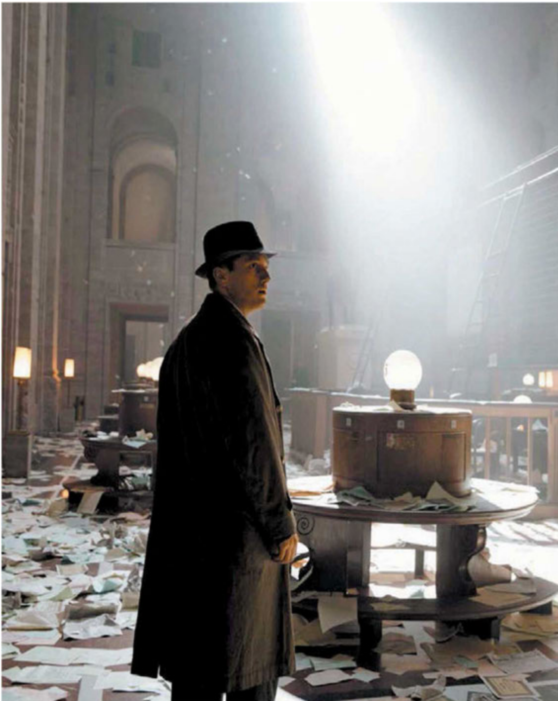
La producción alemana se basa en las novelas de Volker Kutscher. ESPECIAL