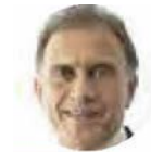
Miguel Ángel Yunes

Después del tren descarrilado por la delincuencia organizada, Miguel Ángel Yunes, gobernador de Veracruz, ordenó a sus policías que, ahora sí, hagan uso de sus armas ante próximos ataques de ese tipo. “Si hay un intento de afectar esta vía de comunicación, las armas serán usadas, que no quede ninguna duda”, sostuvo. La pregunta es ¿y por qué no lo ordenó antes?