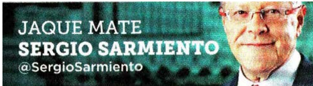
JAQUE MATE SERGIO SARMIENTO @SergioSarmiento

Es irresponsable e ingenuo pretender que podemos compensar el daño de los aranceles punitivos a los autos.