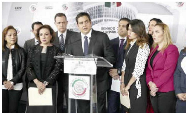
Miembros de la bancada del PAN en el Senado