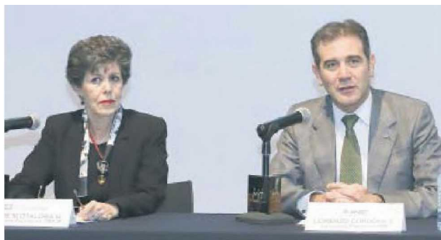
Janine Otálora y Lorenzo Córdova

El consejero presidente del INE, Lorenzo Córdova , y sus compañeros emprendieron una campaña en distintas plataformas para pedirle a los mexicanos que voten fácil mañana domingo y, de esa manera, evitar confusiones para los funcionarios de casillas a la hora de contar los votos. La recomendación de los consejeros es sencilla: los ciudadanos deben marcar un recuadro por el candidato de su preferencia, pues, aunque hay otras opciones válidas en las boletas, lo más fácil es lo más sencillo. Además, los consejeros defendieron que los marcadores para votar no se borran, como falsamente ha circulado la versión en redes sociales. Pero sí explicaron que si los ciudadanos tienen dudas, pues que lleven sus propios marcadores para evitar sospechas. ¿Así o más claro?