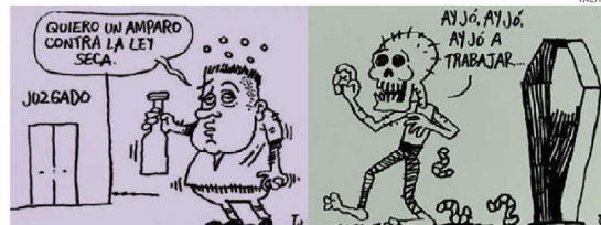
Los damnificados inician su lucha contra la dictadura de la sobriedad.