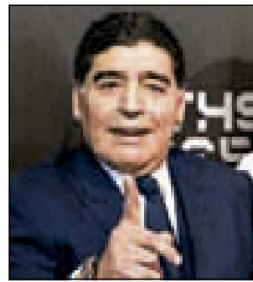
DIEGO ARMANDO MARADONA

El catedrático Conacyt, adscrito al CIQA, es responsable técnico del proyecto Laniauto, un laboratorio impulsado desde hace cuatro años y que actualmente cuenta con más de 40 colaboradores de diversas instituciones. El laboratorio elabora prototipos de autopartes altamente resistentes a altas temperaturas y de bajo peso, los cuales son elaborados con desechos agroindustriales de café y de agave. El especialista del Centro Conacyt explica que los materiales ligeros son una megatendencia que demanda hoy el sector automotriz.