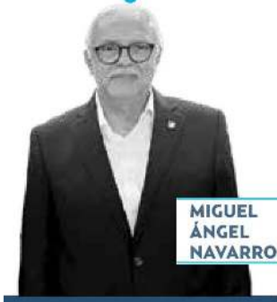
MIGUEL ÁNGEL NAVARRO

► Servicios de calidad mundial en materia de salud comprometió el gobernador de Nayarit, Miguel Ángel Navarro , ante el presidente López Obrador . En la visita que el mandatario federal realizó a la entidad, su anfitrión le pidió despreocuparse, porque “a fin de año habremos de tener servicios comparados con los mejores del mundo, yo se lo afirmé”. Es decir, la entidad nayarita sería algo así como Copenhague, la capital danesa.