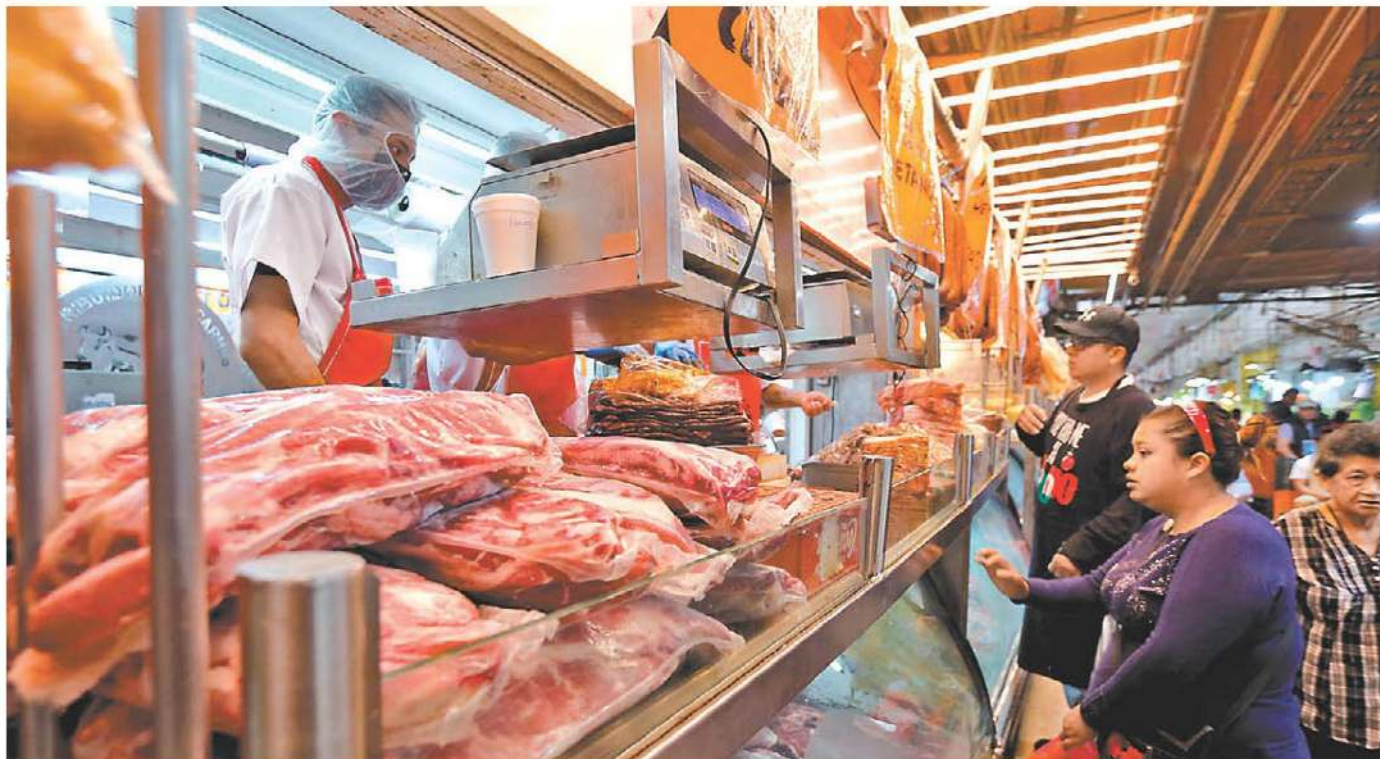
Esta semana el Inegi publicó una radiografía muy precisa sobre el estado de esta deuda moral en México. JAVIER RÍOS