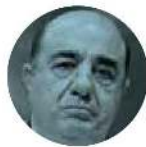
JESÚS MURILLO KARAM

► Servicios de calidad mundial en materia de salud comprometió el gobernador de Nayarit, Miguel Ángel Navarro , ante el presidente López Obrador . En la visita que el mandatario federal realizó a la entidad, su anfitrión le pidió despreocuparse, porque “a fin de año habremos de tener servicios comparados con los mejores del mundo, yo se lo afirmé”. Es decir, la entidad nayarita sería algo así como Copenhague, la capital danesa.