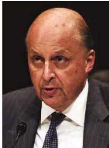
John Dimitri Negroponte.