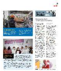
Dante Delgado Rannauro , coordinador nacional de Movimiento Ciudadano.