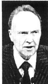
Alejandro Gertz Manero