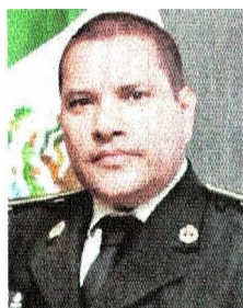
Manelich Castilla Craviotto