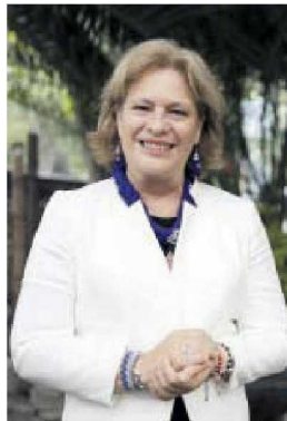
Josefa González Blanco

La Secretaría de Medio Ambiente (Semarnat) y sus organismos sectorizados, dirigidos por Josefa González Blanco , al parecer podrían pisar callos en la 4T, pues está actuando en contra de empresas ligadas a proyectos del actual gobierno. Resulta que esta misma semana, la Agencia de Seguridad, Energía y Ambiente, dependiente de la secretaría, impuso la primera multa del sexenio en materia forestal y de impacto ambiental, nada más y nada menos que a la empresa encargada de desmontar el terreno de la multipublicitada refinería de Dos Bocas. Por no apegarse a la legislación ambiental, la compañía encargada de ese trabajo no sólo deberá desembolsar unos 14 millones de pesos como sanción, sino que deberá