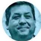
FRANCISCO JAVIER GARCÍA CABEZA DE VACA

► Hablando de diplomacia, nos dicen que sigue el cabildeo en EU para convencer al presidente Joe Biden de que el Air Force One aterrice en el Aeropuerto Felipe Ángeles, el próximo 9 de enero, cuando llegue a México para participar en la Cumbre de Líderes de América del Norte. Pero la Casa Blanca no ha dado respuesta.