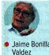
● Jaime Bonilla Valdez

de empatar los comicios estatales con los federales.