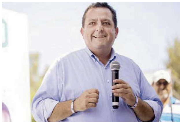
Carlos Mendoza Davis