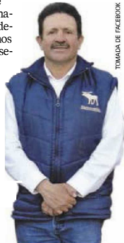
TOMADA DE FACEBOOK