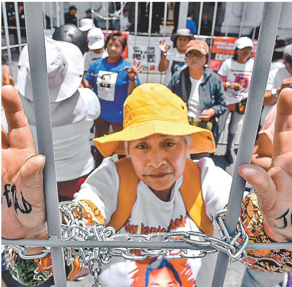
Protestas del colectivo Haz valer mi libertad , en Toluca, Edomex.