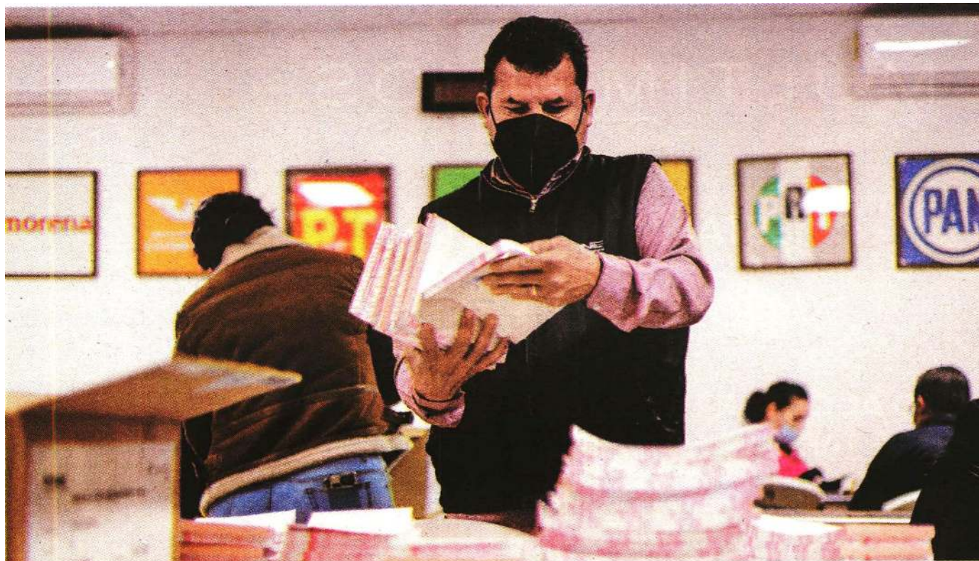
Un empleado del INE almacena papeletas para el próximo ejercicio democrático, en Ciudad Juárez, Chihuahua.

El Presidente quiere definiciones de los de afuera, pero sobre todo de los de adentro, ese es el verdadero objetivo