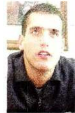
Jorge Emilio González

:::: Cuentan que el mandamás del Partido Verde, Jorge Emilio González Martínez , ya le anda jugando chueco a Morena y a su candidata a la gubernatura de