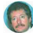
Luis D. Colosio

No pocos se percataron de que el presidente López Obrador parafraseó, en dos eventos, la máxima más famosa de Luis Donald Colosio, candidato presidencial asesinado en 1994. "Veo un México con sed de justicia", dijo ayer, primero en Zacatecas y luego en San Luis Potosí. Pero agregó algo de su cosecha: "con la cuarta transformación se va a saciar esa sed".