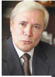
Jaime Bonilla Valdez