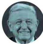
ANDRÉS M. LÓPEZ OBRADOR