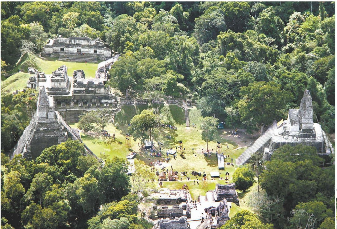
Ella viajó a Tikal, Guatemala, en una avioneta que se desplomó en algún lugar de la selva maya. ESPECIAL

Ella, que parecía de izquierda, era originaria de Turín, sin duda, la ciudad más burguesa de la bota italiana