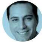
MAURICIO VILA DOSAL

► De manteles largos está hoy el secretario de Gobernación, Adán Augusto López . Festeja su cumpleaños, pero desde ayer políticos de todos colores empezaron a felicitarlo y a reconocer su labor como encargado de la gobernabilidad del país. De hecho, Rosa Icela Rodríguez , Luis Cresencio Sandoval , Rafael Ojeda , Ricardo Mejía Berdeja , Estela Ríos , Luis Rodríguez Bucio y Lázaro Cárdenas lo festejaron con dos pasteles de chocolate, al terminar la reunión del gabinete de seguridad.