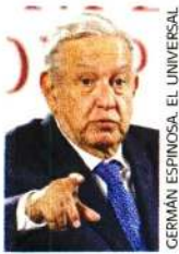
GERMÁN ESPINOSA, EL UNIVERSAL Andrés Manuel López Obrador

::::: Nos comentan que el Gabinete de Seguridad está en estado alerta y se prevé que el lunes sean desplegados docenas de elementos de seguridad federales y de la Ciudad de México para proteger Palacio Nacional de presuntas amenazas por parte de grupos radicales que buscan lanzar bombas molotov y piedras en la marcha por el octavo aniversario de la desaparición de los 43 normalistas de Ayotzinapa por lo que, nos detallan, las vallas metálicas de más de dos metros podrían ser instaladas