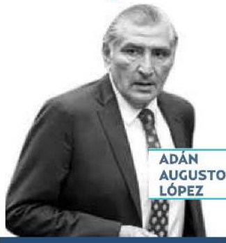
ADÁN AUGUSTO LÓPEZ

► De manteles largos está hoy el secretario de Gobernación, Adán Augusto López . Festeja su cumpleaños, pero desde ayer políticos de todos colores empezaron a felicitarlo y a reconocer su labor como encargado de la gobernabilidad del país. De hecho, Rosa Icela Rodríguez , Luis Cresencio Sandoval , Rafael Ojeda , Ricardo Mejía Berdeja , Estela Ríos , Luis Rodríguez Bucio y Lázaro Cárdenas lo festejaron con dos pasteles de chocolate, al terminar la reunión del gabinete de seguridad.