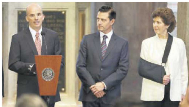
El Presidente y los secretarios de Hacienda y Cultura