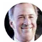
José A. Meade

Lo que nos adelantan es que es casi seguro que los candidatos del PRI a la Presidencia y a jefe de Gobierno de la CDMX, José Antonio Meade y Mikel Arriola, cerrarán campaña, juntos, el domingo en el Palacio de los Deportes. Ambas casas de campaña trabajan de manera coordinada con las dirigencias nacional y local del partido, para que el acto salga a la perfección.