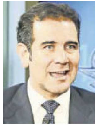
Lorenzo Córdoba Vianello

En la sede del Instituto Nacional Electoral se escuchan distintas versiones sobre videos que han aparecido en las redes sociales, en los que supuestamente se observa que los marcadores de tinta indeleble para la jornada de votación no funcionan. Se han colocado en una esquina los representantes de Morena, quienes se dicen preocupados por la situación, y en la otra esquina se ha ubicado el consejero presidente del INE, Lorenzo Córdoba . Los primeros defienden los videos que circulan en redes, pero Córdoba llamó a los medios de comunicación a combatir las fake news . “¡Noticia