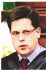
CRÉDITO DE FOTO