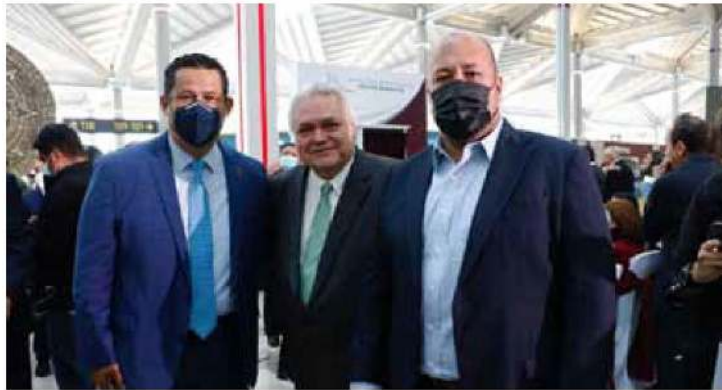
El gobernador de Jalisco, Enrique Alfaro Ramírez, fue uno de los políticos de alto nivel que asistieron a la inauguración del AIFA.