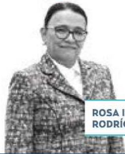
ROSA ICELA RODRÍGUEZ

› Mucho interés hay en Washington por la reunión que sostendrán funcionarios mexicanos y estadounidenses para acordar medidas contra el tráfico de fentanilo y otras drogas. El próximo jueves, la secretaria de Seguridad, Rosa Icela Rodríguez , encabeza la delegación de nuestro país, y nos adelantamos que, bajo el brazo, lleva datos sobre las acciones emprendidas contra ese flagelo. Y es probable que China salga a relucir en el diálogo.