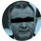
GENARO GARCÍA LUNA

› Nos adelantamos parte de lo que el presidente López Obrador pedirá al dueño de Tesla, Elon Musk , en la llamada telefónica que sostendrán en las próximas horas para conocer la entidad del país en la que instalará su planta. Para el mandatario es muy importante dar facilidades para que éste y otros empresarios inviertan en México, pero también que los complejos que colquen en territorio nacional no contaminen y no consuman agua en exceso.