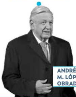
ANDRÉS M. LÓPEZ OBRADOR

› Nos adelantamos parte de lo que el presidente López Obrador pedirá al dueño de Tesla, Elon Musk , en la llamada telefónica que sostendrán en las próximas horas para conocer la entidad del país en la que instalará su planta. Para el mandatario es muy importante dar facilidades para que éste y otros empresarios inviertan en México, pero también que los complejos que colquen en territorio nacional no contaminen y no consuman agua en exceso.