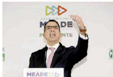
Javi, cada que habla le resta 2% al dotor Mit .