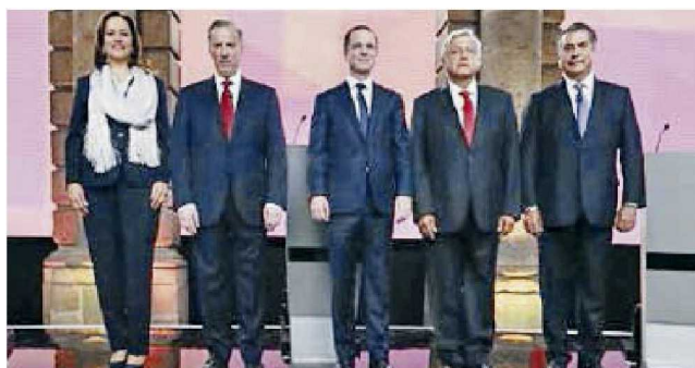
Margarita Zavala y los candidatos a la Presidencia