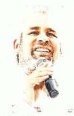
Alfredo Ramírez Bedolla

:::: Hay dos formas de analizar lo que pasó con la suspensión de las exportaciones de aguacate michoacano a Estados Unidos. Por una parte, el gobierno federal y el de Michoacán, Alfredo Ramírez Bedolla , se manifestaron confiados de que el tema se resolvería en corto tiempo, como al final pasó. Sin embargo, desde la trinchera opositora lo que se percibe es cada vez más frecuentes reclamos en aquel país contra asuntos que ocurren dentro de México, desde temas medioambientales hasta el asesinato de periodistas. Ayer mismo, Brian A. Nichols , subsecretario de Estado para Asuntos del Hemisferio Occidental de Estados Unidos, emitió un mensaje en Twitter en el que condena las agresiones en contra de los comunicadores mexicanos y señaló que es necesario demandar acciones para protegerlos. ¿Son sólo coincidencias temporales o el poderoso vecino quiere mandar un mensaje velado?