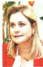
María Eugenia Campos

:::: El presidente Andrés Manuel López Obrador demostró ayer en su gira de trabajo por Ciudad Juárez, Chihuahua, junto con la gobernadora María Eugenia Campos (PAN), que no solo con los gobernadores de Morena tiene buena relación y trabajo coordinado, al presumir ese mismo trato con la mandataria panista. Pero eso no fue todo, el Ejecutivo federal le hizo un “guiño” político: “Ahora que está malita de la derecha (por una lesión en la mano) me da más gusto, porque está muy bien de la izquierda”, dijo entre risas. Falta ver cómo interpretan ese guiño en la dirigencia nacional de PAN, que encabeza Marko Cortés Mendoza .