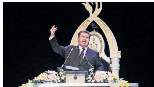
Naasón Joaquín García

BAJO RESERVA es elaborada con aportación de periodistas y colaboradores del diario previamente verificadas. Para comentarios comunicarse al 5709 1313, extensión 2421 o al email editor@eluniversal.com.mx