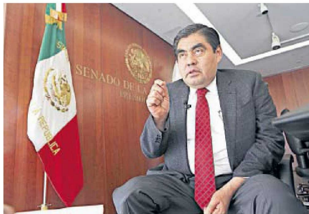
Miguel Barbosa Huerta