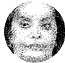
Elba Esther Gordillo