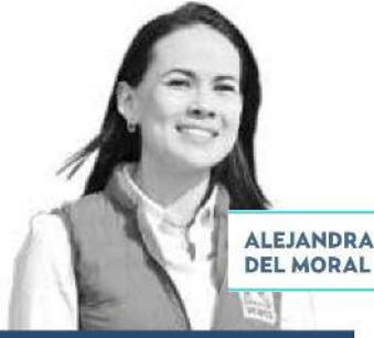
ALEJANDRA DEL MORAL