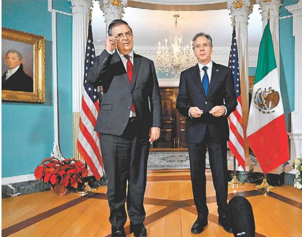
Ebrard y Blinken se reunieron para afinar la agenda del encuentro entre mandatarios.