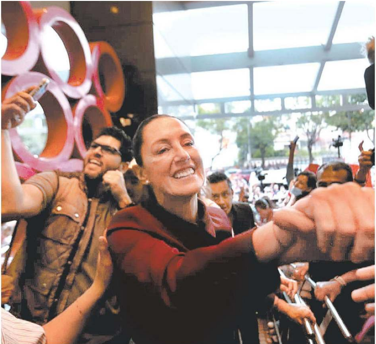
Claudia Sheinbaum a su llegada al hotel sede de Morena para su registro.