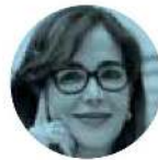
LA VEN COMO GOLPEADORA

► Resulta que el INE, presidido por Guadalupe Taddei , avaló los recorridos por el país que inician las corcholatas de Morena a partir del lunes. Eso sí, la Comisión de Quejas recomendó a los aspirantes que "tomen en cuenta las reglas establecidas en la ley electoral, en cuanto a no violar los principios de neutralidad e imparcialidad".