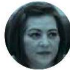
PALOMEA INE GIRA DE CORCHOLATAS

► Alicia Bárcena , propuesta del presidente López Obrador como canciller, aprovechó uno de sus últimos actos como embajadora en Chile para informar que el mandatario mexicano visitará ese país sudamericano el 11 de septiembre próximo. El viaje es a invitación del presidente chileno Gabriel Boric para que lo acompañe en la ceremonia conmemorativa del 50 aniversario del Golpe de Estado contra Salvador Allende . Ella, por supuesto, irá con él.