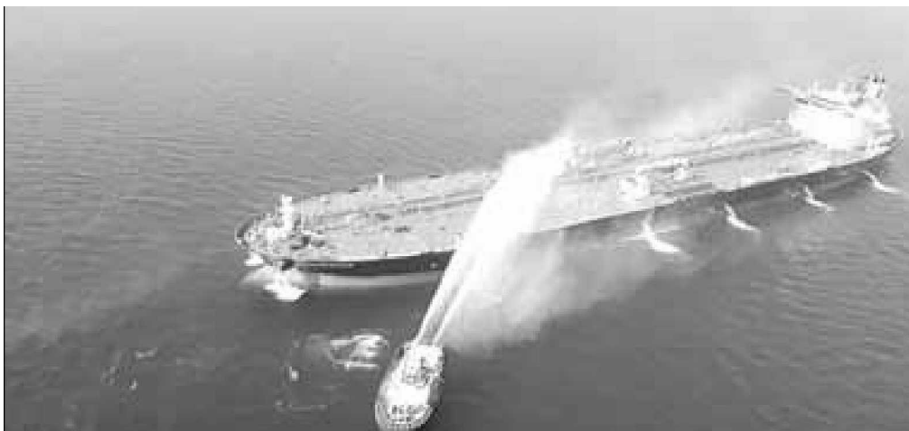
Un barco de la Marina iraní intenta controlar el fuego de un petrolero noruego del Frente Altair en el golfo Omán .