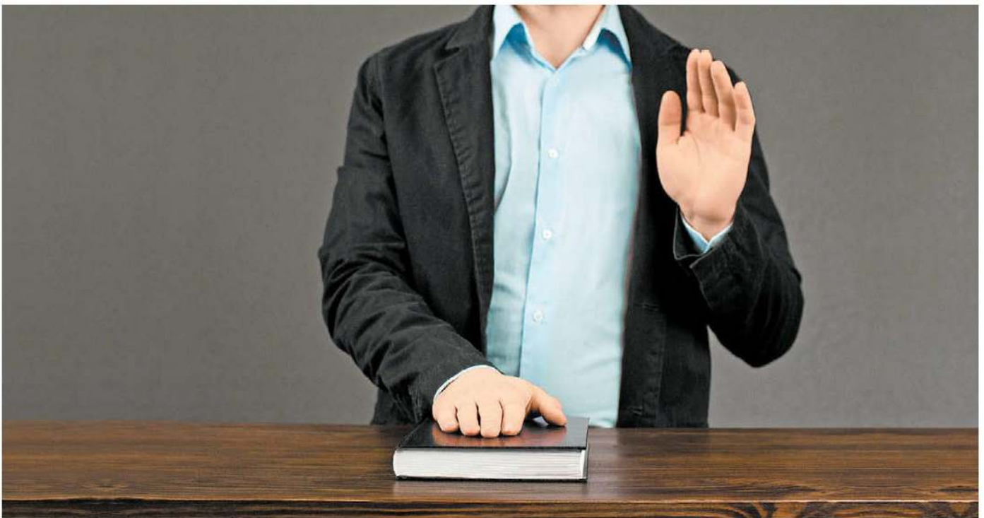
El territorio de la verdad suele caer en manos de aquel que cuente con el respaldo más abultado.