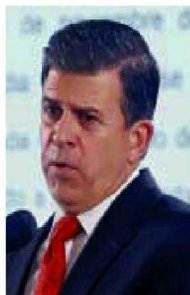
Ricardo Sheffield Padilla

Nos adelantan que este lunes en la conferencia de prensa en Palacio Nacional, al presentar el informe “¿Quién es quién en los precios de la gasolina?”, Ricardo Sheffield Padilla , titular de la Procuraduría Federal del Consumidor, anunciará que la dependencia a su cargo interpondrá denuncias penales ante la Fiscalía General de la República (FGR) contra gasolineras que se negaron a ser revisadas, a pesar de que verificadores de la Profeco iban acompañados por elementos de la Guardia Nacional. Sin embargo, nos comentan que eso no es todo, sino que a las denuncias