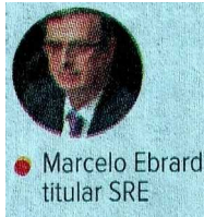
Marcelo Ebrard, titular SRE

Ebrard rechazó que se satisfaga la exigencia trumpiana de volver a México un "tercer país seguro".