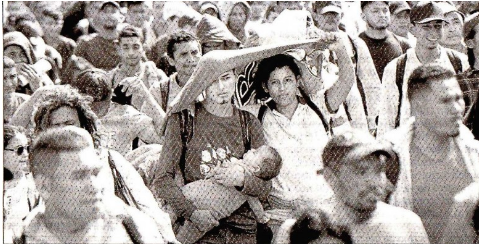
▲ Migrantes hondureños, entre ellos familias enteras, caminan cerca de Esquipulas, departamento de Chiquimula, Guatemala, después de cruzar la frontera en Agua Caliente desde Honduras, en su camino a Estados Unidos. El gobierno mexicano ya anunció que impedirá el paso de esta nueva caravana.