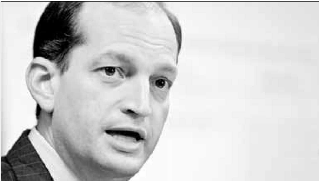
El viernes Alexander Acosta renunció a su cargo de secretario del Trabajo de EU.