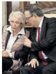
Olga Sánchez Cordero y Marcelo Ebrard