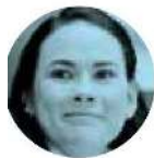
PANAL SE VA CON LA ALIANZA

› Cinco nuevas embajadas abrirá este año la Cancillería, a cargo de Marcelo Ebrard . Las sedes serán Kazajistán, Bangladesh, Pakistán, Costa de Marfil y Senegal. Lo interesante del asunto es que sus titulares se designarán por concurso, es decir, ya no será el presidente López Obrador quien realice directamente los nombramientos, con lo ha hecho en los últimos casos al poner al frente de algunas representaciones a exgobernadores y amigos.