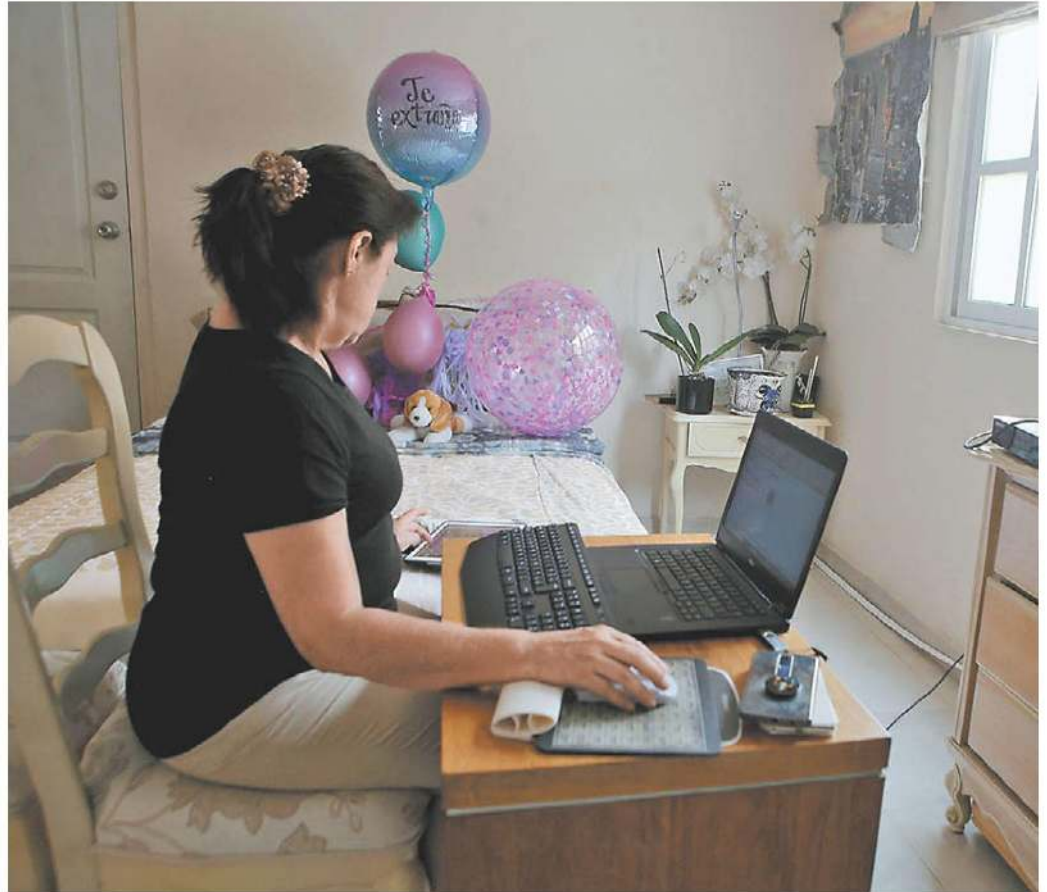
El trabajo a distancia iba ganando popularidad, pero durante la pandemia explotó. ESPECIAL

Este fenómeno deja buenos dividendos económicos y ubica a la ciudad elegida como capital de un nuevo orden global