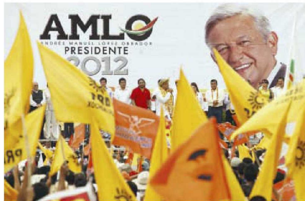
AMLO, en 2012, en campaña por la Presidencia

Nos cuentan que la medida de liquidar a sus aproximadamente 200 empleados de base en el PRD fue provocada, principalmente, por una multa que les impuso el INE a los amarillos de 125 millones de pesos, derivada del proceso electoral de 2012, donde Andrés Manuel López Obrador , ahora presidente electo, fue su candidato presidencial. Nos cuentan que a partir del pasado mes de agosto, el PRD comenzó a pagar esta multa, lo que redujo a 50% las prerrogativas del sol azteca. De qué tamaño será la crisis política y financiera en el PRD que hasta su propio presidente nacional, Manuel Granados , está pensando renunciar a sus 38 mil pesos de sueldo mensual para que el partido siga a flote. Lo cierto es que entre liderazgos del sol azteca, hoy en franco eclipse, existe la percepción de que López Obrador se llevó todo lo que pudo del partido en cuanto a militantes y que los pocos que quedan de plano no ven para cuándo y cómo puedan revivir al partido que en algún momento fue el principal de la izquierda.