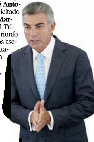
José Antonio Gali Fayad

Para más de uno, nos dicen, parece sospechoso que el gobernador de Puebla, José Antonio Gali Fayad (PAN), no haya felicitado en sus redes sociales a la panista Martha Erika Alonso , luego de que el Tribunal Estatal Electoral ratificó su triunfo como gobernadora. Hecho que, nos aseguran, derivó en un sinfín de felicitaciones de la clase política local. Sin embargo, para otros, el mutis del mandatario no es un mal síntoma, pues, nos recuerdan, todos los recursos legales para revertir dicha decisión no se han agotado. Prudencia, nos dicen, es la estrategia de Gali Fayad.