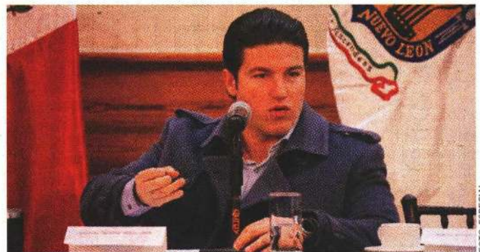
El gobernador Samuel García acusó a los alcaldes y diputados de oposición de intentar robarle al estado 12 mil millones de pesos.

Y bueno, el coordinador de la bancada del PAN , Carlos de la Fuente , anunció que alistan una reforma a la Ley de Egresos de 2022 para que el próximo año se consideren más recursos para los organismos autónomos.