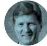
ENRIQUE DE LA MADRID