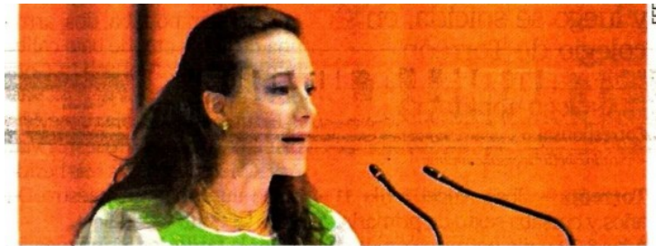
María Fernanda Espinosa

la tarea parlamentaria. Durante más de 20 años el Canal del Congreso ha transmitido el quehacer del Poder Legislativo en la señal 45.1 y va por seguir el trabajo de los senadores en el 45.2 y de los diputados federales en el 45.3. Así que si los jefes del Congreso quieren TV, pues que le pongan billete, nos dicen. Ahí les hablan, don Mario Delgado y don Ricardo Monreal .