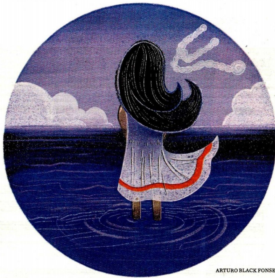
ARTURO BLACK FONSECA