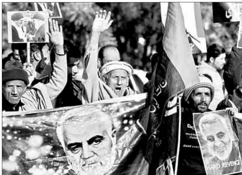
Musulmanes chiítas paquistaníes, ayer durante una manifestación en Islamabad contra el asesinato del general iraní Qasem Soleimani, perpetrado la semana pasada en la capital iraquí por fuerzas de Estados Unidos.

© The Independent Traducción: Jorge Anaya