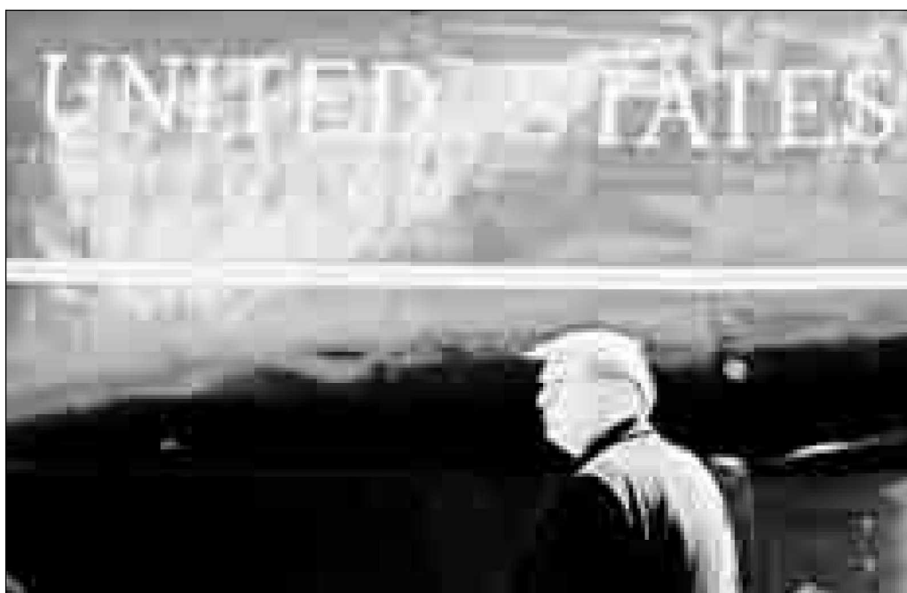
Donald Trump intenta desplegar toda su panoplia multidimensional para jalar a Rusia a una alianza "Occidental" de la raza blanca contra la raza amarilla de China.