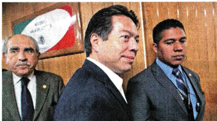
Pablo Gómez y Mario Delgado

La comida con carnes y ensaladas del viernes en Toluca, con todos los gobernadores del PRI y Manuel Velasco , el único Verde —hoy con tintes morenos—, dicen que se prolongó un buen rato. El anfitrión fue Alfredo del Mazo . Nos cuentan que no hubo gritos ni sombrerazos, pero que sí se habló de la cordialidad que ha marcado el proceso de transición entre el presidente Enrique Peña Nieto y su sucesor Andrés Manuel López Obrador . También comentaron sobre el espinoso asunto de los súper delegados de López Obrador y el rol de ellos como gobernadores. Pero, aseguran, algo que les hizo levantar las cejas fue el comentario de Peña Nieto en el sentido de que no se va a inmiscuir en el proceso de revisión interna del PRI. “Eso lo dejó muy claro”, nos comentó un mandatario. Vamos a ver.